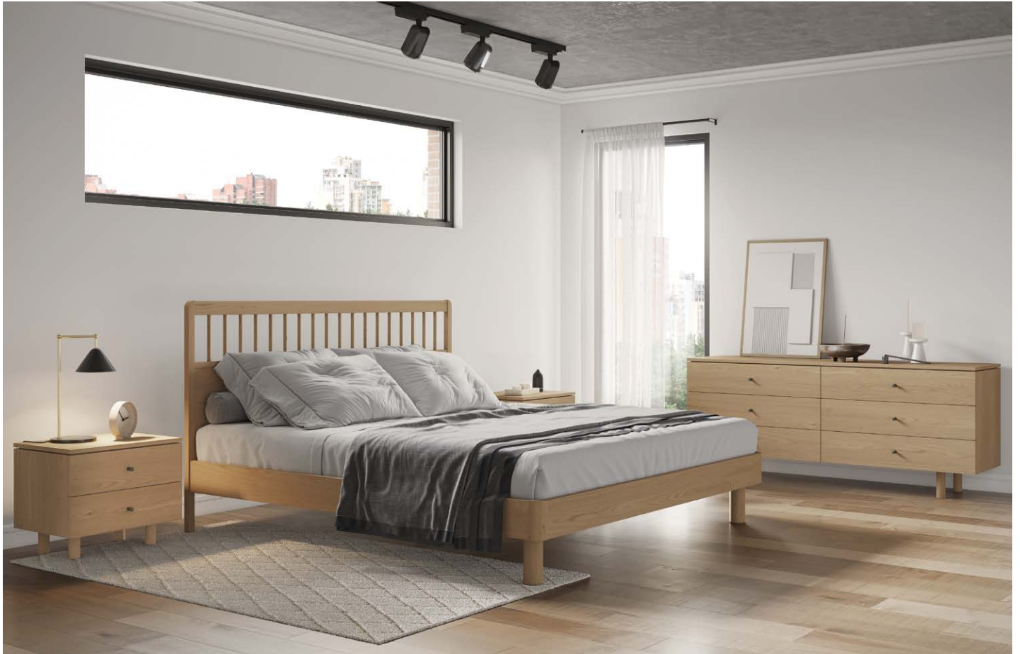
1NOR23 Table de nuit, 2 tiroirs Night table, 2 drawers 23.5" x 17" x 19.5"