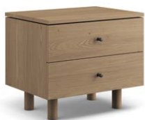
1NOR23 Table de nuit – 2 tiroirs Night table – 2 drawers 23.5" x 17" x 19.5"