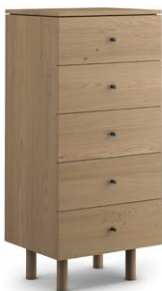
1NOR24 Semainier - 5 tiroirs Narrow chest – 5 drawers 23.5" x 19.5" x 50.75"