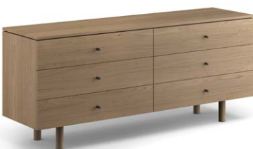
1NOR72 Bureau double - 6 tiroirs Double dresser – 6 drawers 72" x 19.5" x 30"

Présenté en Chêne rustique (#175) avec poignées noires. Shown in Rustic oak (#175) with black handles.